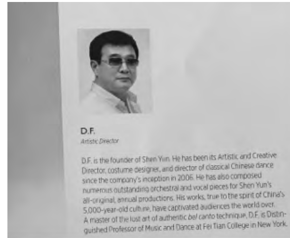
▲李洪志在"神韻"廣告上的背景簡介

不僅如此，"神韻藝術團"還是李洪志、李瑞夫婦具體操控下實打實的"夫妻店"李洪志是"神韻"的藝術總監，李瑞是"神韻"的財務總監。"神韻"的巨額收益最終流向了哪裏，不言自明。