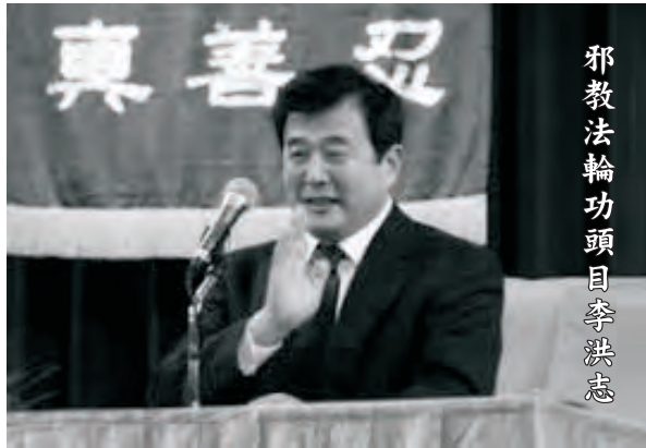
邪教法輪功頭目李洪志

1998年，“法輪功”鼓動信徒圍攻齊魯晚報，起因是齊魯晚報發布對該邪教的調查報告。1999年4月25日，1萬多名“法輪功”練習者在中南海周圍非法聚集，嚴重影響社會治安秩序。1999年7月22日，中國政府依法取締了“法輪功”邪教組織。當時，頭目李洪志的一系列罪行，包括洗錢和逃稅等經濟罪行也都引起執法部門的關注。李洪志利用信徒斂財，其中包括讓信徒高價購買帶有其畫像的宣傳畫。在該邪教最為猖獗時期，在中國不同城市有