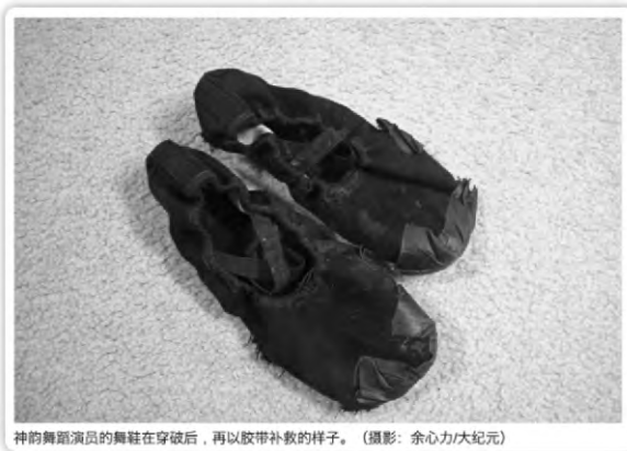
神韻舞蹈演員的舞鞋在穿破後，再以膠帶補救的樣子。

報道稱，許多布里斯托人可能收到過通過門縫塞進他們家中的《大紀元時報》，「法輪功」信徒試圖藉此傳播信息，而「神韻藝術團」實質上是「法輪功」的另一種傳播途徑。