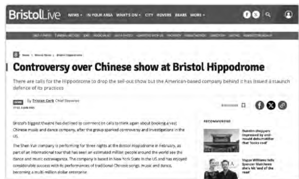
▲英國媒體《布里斯托郵報》(Bristolpost.co.uk)網站2025年1月6日截圖

一位競技場劇院常客在「布里斯托爾線上」(Bristol Live)欄目上匿名表示，「作為布里斯托爾人，我深感自豪，但也對這座城市與奴隸制的歷史聯繫懷有懺悔之心。他進一步表示，「在我看來，接待『神韻』可能有損競技場劇院的聲譽，並與其官方聲明中提到的解決奴隸制問題的明確承諾相矛盾」。