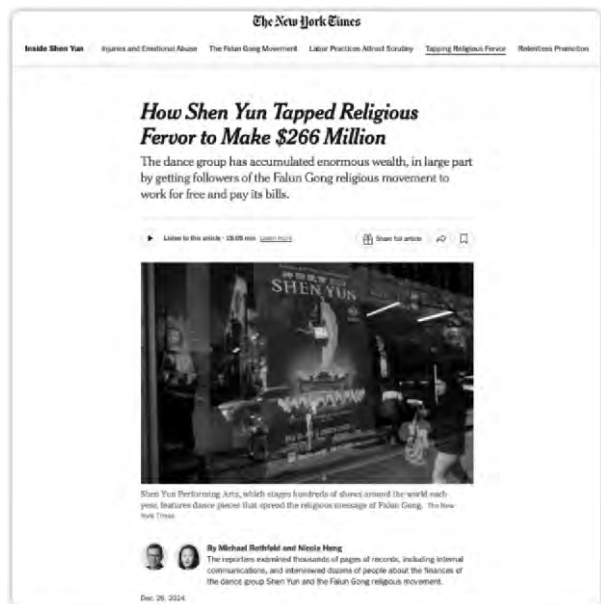
▲2024年12月29日，《紐約時報》刊登重磅調查文章，曝光「法輪功」和李洪志家族種種斂財手段

最近幾個月，紐約州勞工部對「神韻藝術團」發起調查，但拒絕公布調查細節。勞工部的執法範圍包括童工、加班以及最低工資等方面。