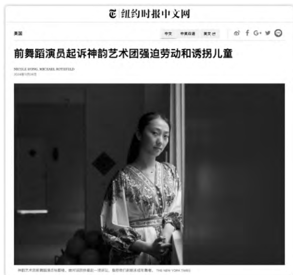
▲《紐約時報》報道前演員已對「神韻」提起訴訟

一位競技場劇院常客在「布里斯托爾線上」(Bristol Live)欄目上匿名表示，「作為布里斯托爾人，我深感自豪，但也對這座城市與奴隸制的歷史聯繫懷有懺悔之心。他進一步表示，「在我看來，接待『神韻』可能有損競技場劇院的聲譽，並與其官方聲明中提到的解決奴隸制問題的明確承諾相矛盾」。