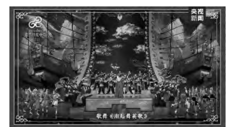
總台蛇年春晚歌舞《潮起舞英歌》