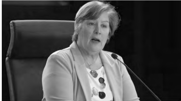
圖為魁北克上訴法院法官霍格（Marie-Josée Hogue）主持外國干預加拿大選舉調查。

【時報訊】根據外國干預公共調查（Public Inquiry into Foreign Interference）的最終報告，加拿大的民主制度依然“穩健”，且在議會中“沒有發現‘叛徒’的證據”。然而，聯邦政府應採取措施，更好地保護民主制度，並加強公眾對外國干預威脅的了解。