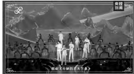
總台蛇年春晚歌曲《門柄指東天下春》

出，蛇年春晚創新運用超高清、虛擬現實、人工智能、立體視覺等技術，帶來更加驚艷的視聽效果，這些新科技、新手段一旦推出很快就會被全世界研究、「買單」，這樣的科技賦能讓春晚、春節更有時代特色。