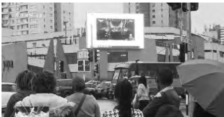
肯尼亞首都內羅畢商場大屏播放總台蛇年春晚

作為最廣受喜愛的春節新年俗——「除夕夜看春晚」，今年也成了海內外焦點，全世界觀眾可以通過春晚最直接地了解春節。除夕晚8點，總台蛇年春晚如約而至，以春節申遺成功為契機，結合傳統文化與先進技術，為全球受眾帶來了一場歡樂吉祥、喜氣洋洋的視聽盛宴。全球有200多個國家和地區的2900多家媒體對春晚進行了同步直播和報道，全球閱讀量超17.38億次，海外視頻觀看量5.2億次，境內社交媒體話題閱讀量達270億次，截至1月29日2時，全媒體累計觸達168億人次，移動端受眾規模3.72億人，海內外輿論掀起的乙巳蛇年「春晚熱」持續沸騰擴大。