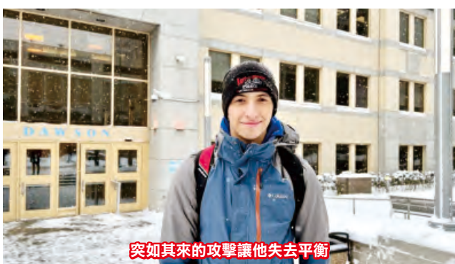
突如其來的攻擊讓他失去平衡

與其同時，古帖雷斯希望透過分享他的經驗能鼓勵其他通勤者保持警惕。「注意周圍環境並靠近牆壁，」他建