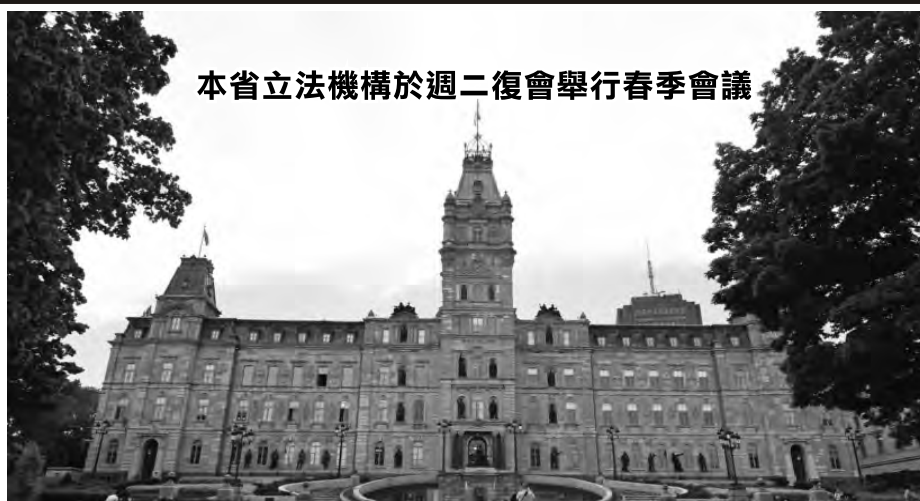
本省立法機構於週二復會舉行春季會議

普拉蒙登並沒放棄對獨立的支持，他於上週表示不會受到特朗普政府「動盪」的影響。但他也承認，在所有人目光都集中在白宮的情