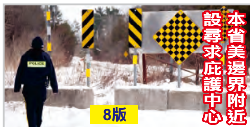
本省美邊界附近 設尋求庇護中心