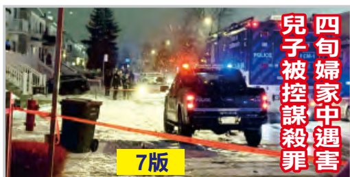
四旬婦家中遇害 兒子被控謀殺罪