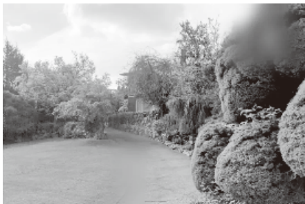
李老先生位於溫西的其中一處房產，5570 Kingston Road。

【時報訊】一位香港富商的兒子聲稱已故父親的妻子在其父去世前後從各種賬戶中提取數百萬元，用於為她和她的孩子買房，並出售及佔有價值數百萬元的房產，請求法院判令歸還。