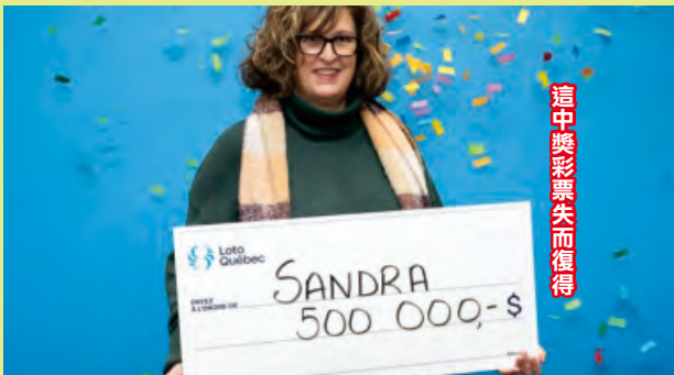
這中獎彩票失而復得

中獎彩票是去八月十三日Lotto Max 大獎一部份，突琳及時把彩票尋回的確令人驚訝，因為獎金有效的日子所剩不多。本來以為是廢票的她在