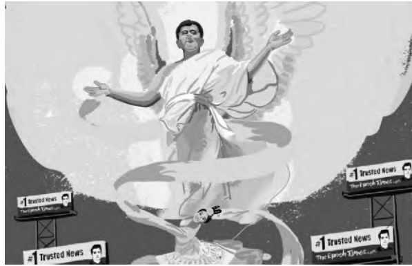
▲美國媒體漫畫揭示「神韻演出」與「法輪功」邪教和李洪志的利益息息相關。

【正義真相】2024年12月27日，美國亞利桑那州圖森市一名畫廊業主投書圖森網（Tucson.com），針對「法輪功」邪教所屬「神韻藝術團」準備到當地演出之事，提醒當地民眾要認清「神韻」背後存在的種種爭議、黑幕及李洪志等人的真面目。該作者指出，支持「神韻」就是支持一個目前正在接受當局虐待罪行調查的極右翼組織。文章編譯如下：