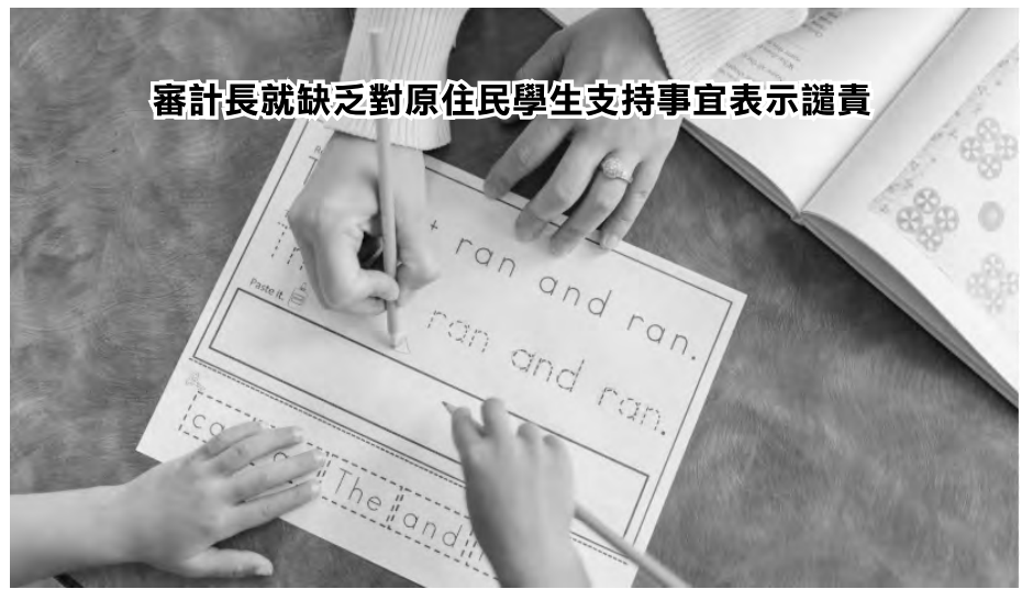
審計長就缺乏對原住民學生支持事宜表示譴責