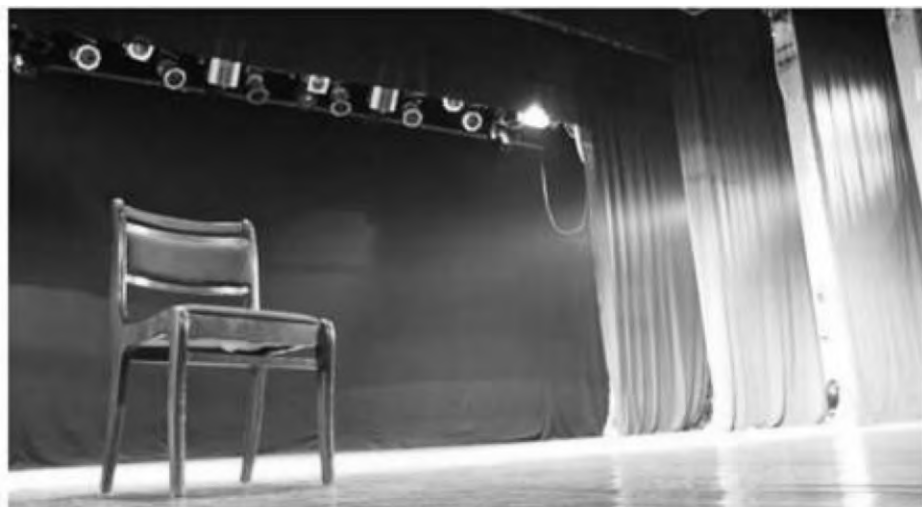
▲空蕩蕩的「神韻藝術團」舞台。原文截圖