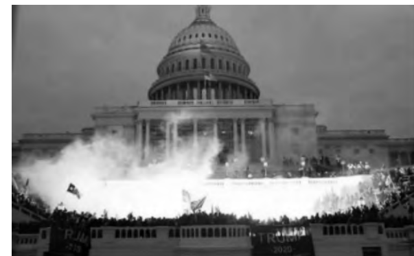
▲2021年1月6日，美國國會大廈發生暴動騷亂

2021年1月6日，美國國會大廈發生暴動，導緻6人死亡，震驚世界。"法輪功"不但參與其中，還在其各類媒體和社交平台上散布大量虛假信息和謠言，對暴動行為煽風點火，推波助瀾。美國商業科技新聞網、媒體事務網等媒體發布調研報告及文章，明確指出"法輪功"是國會大廈恐怖活動參與者。