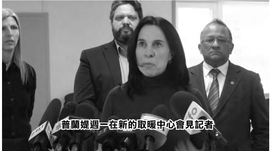
普蘭媿週一在新的取暖中心會見記者