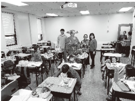
祝各位同學、家長、教師及義工，新春快樂、平安如意、恭喜發財！