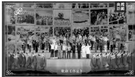
各行各業勞動者代表演唱，總台蛇年春晚歌曲《偉業》

今年春晚把各個領域奉獻拼搏的普通人請到聚光燈下，種花爺爺、「外賣詩人」等普通民眾擔任節目報幕，農民歌手、教師、醫生等數十位一線勞動者代表登台演唱，展現了新征程上築夢者拚搏奮鬥的前進步伐。香港同胞陳先生表示，「我們每一個普通人一年的辛苦付出都有被看到、被尊重，具象化地演繹了每一個人都是主角，每一份付出都彌足珍貴，每一束光芒都熠熠生輝。」