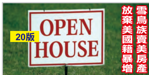
雪鳥族賣美房產 放棄美國籍暴增