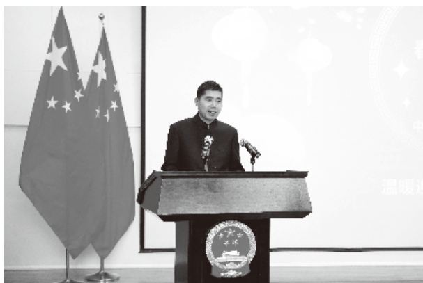
【時報訊】1月23日，駐加拿大使館舉辦“溫暖迎春·共慶中國年”2025年華人華僑春節招待會。加聯邦前參議員胡子