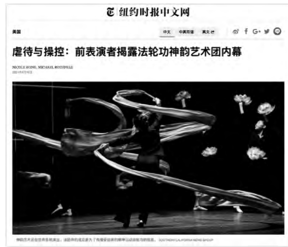
▲《紐約時報》報道「神韻」虐待演員調查文章截圖

基教」（又稱「科學教派」）。（諸多）前舞蹈演員現在正對「神韻」提起虐待起訴，《紐約時報》最近一項調查曝光了「神韻」多起虐待舞蹈演員的案例，這篇題為《虐待與操控：前表演者揭露法輪功神韻藝術團內幕》（Behind the Pageantry of Shen Yun, Untreated Injuries and Emotional Abuse）的文章可以在互聯網上找到。