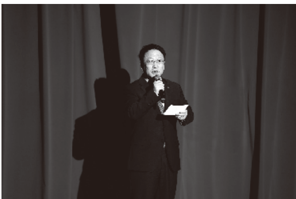
【時報訊】1月25日，中國駐蒙特利爾總領事戴

玉明出席2025年蒙特利爾中國留學人員春節聯歡晚會並致辭。在蒙留學人員、中方學者以及教育機構代表等500余人觀看晚會。