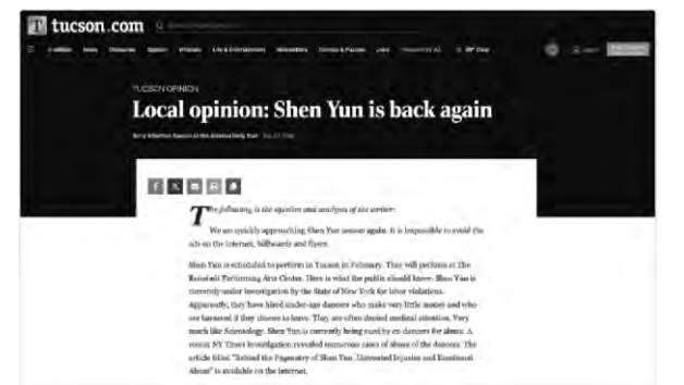
作者：Terry Etherton 蘇珊（編譯）