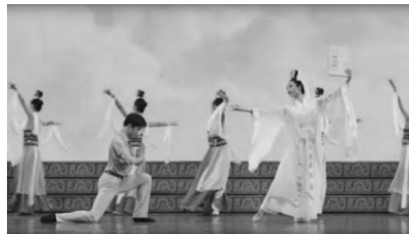
▲"神韻演出"中身穿白衣的舞者手舉《轉法輪》

至此，"法輪功"已然撕下氣功、宗教等偽裝，變身成為一個徹頭徹尾的反華政治組織，就連其精心打造的"文化"品牌"神韻"，也成為其不折不扣的政治宣傳工具。