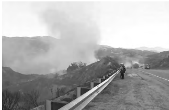
通信基礎設施面臨威脅，截至24日，該山火僅約10%的火勢得到控制。

美國加利福尼亞州洛杉磯地區北部爆發的山火近日得到部分控制，但加州南部其他地區又連續發生數起火災。其中最新發生的一起是在23日下午，加州南部聖迭戈縣的美國與墨西哥邊境處燃起的名為「邊界2號」的山火。截至24日，該山火的過火面積已達約22平方公里。加州林業和消防局表示，儘管該山火影響地區的人口密度不高，但當地關鍵