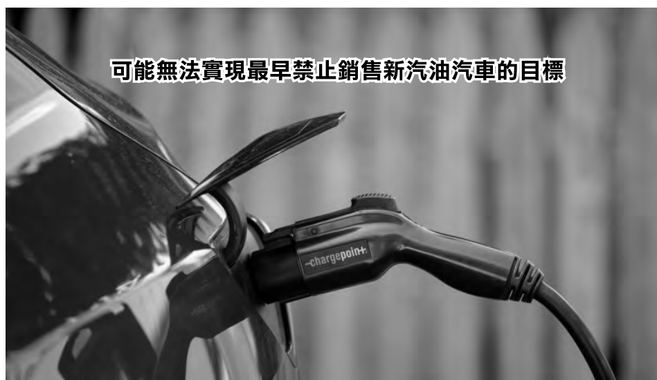
可能無法實現最早禁止銷售新汽油汽車的目標