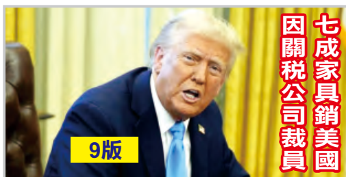
七成家具銷美國 因關稅公司裁員