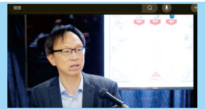
地緣政治對加拿大華裔的影響： 挑戰與機遇