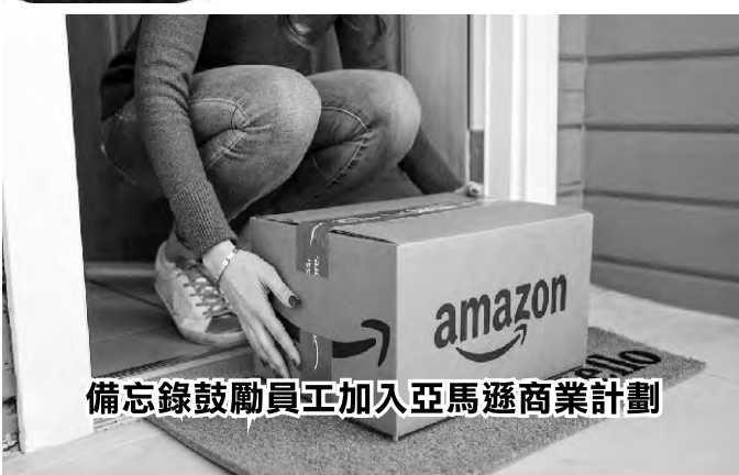
備忘錄鼓勵員工加入亞馬遜商業計劃

根據Noovo Info新聞社獨家報道，聯邦公園管理局(Parks Canada)的一份備忘錄鼓勵員工加入亞馬遜的商業計劃，購買辦公用品和其他用品，引發軒然大波。