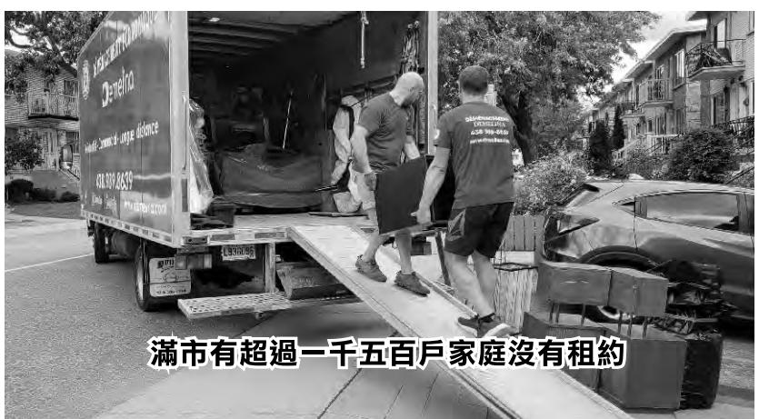
滿市有超過一千五百戶家庭沒有租約

年的數據，新租戶的公寓平均租金漲幅（百分之八點七）遠高於續租的公寓（百分之四點七）。