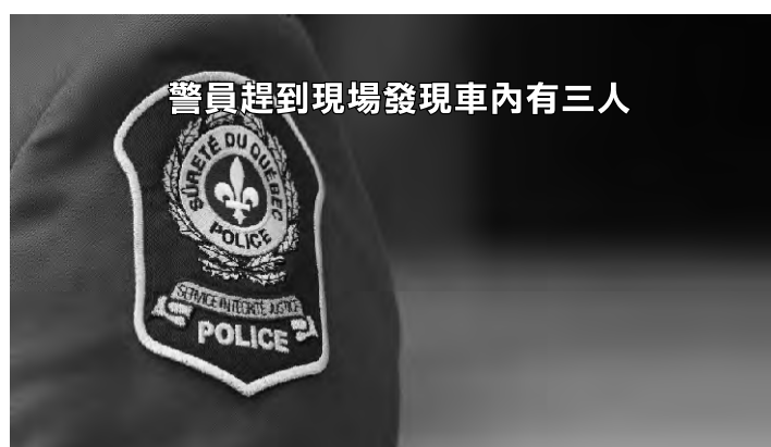
警員趕到現場發現車內有三人

魁市警方表示，他搜查該地區，並在距離du Bourg-Royal路和路易十四大道不遠處找到了可疑車輛。