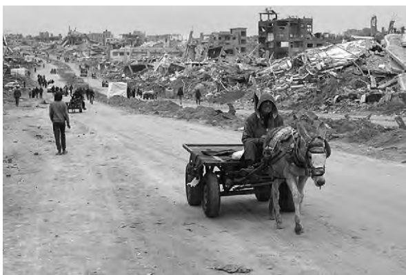
2月5日，加沙地帶傑巴利耶難民營

英國《金融時報》評論稱，特朗普的“超現實”言論顯然超出了外界預期，這不僅可能違背特朗普關於從中東撤軍的承諾，還將激怒美國的歐洲盟友、阿拉伯國家和全球南方國家。特朗普似乎堅持以房地產商人的視角看待中東問題，將加沙視為“有價值的交易籌碼”。