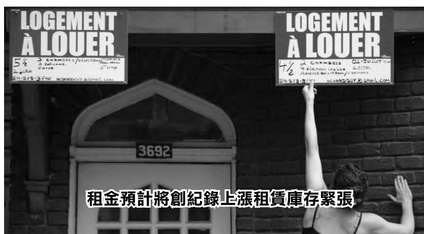
租金預計將創紀錄上漲租賃庫存緊張

年的數據，新租戶的公寓平均租金漲幅（百分之八點七）遠高於續租的公寓（百分之四點七）。