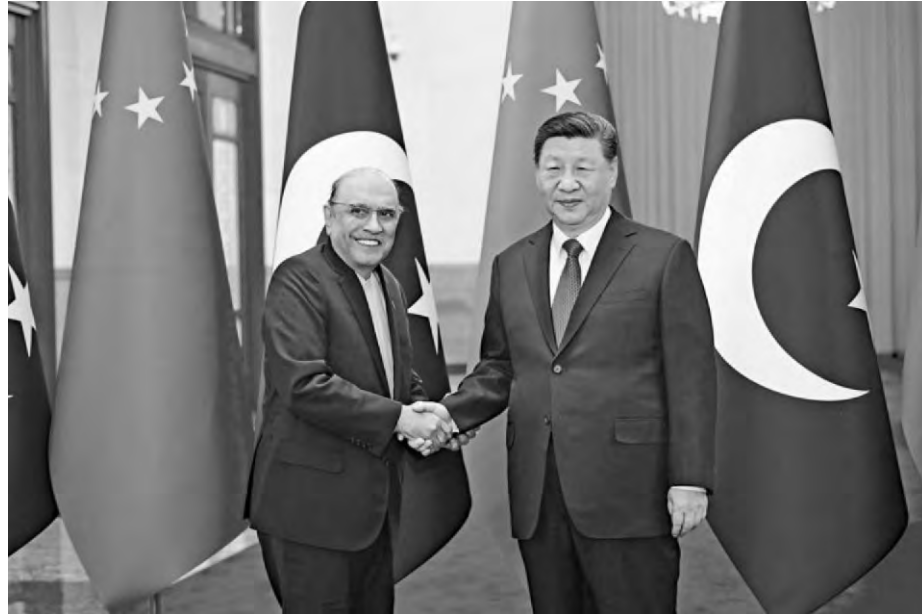
圖：2月5日下午，中國國家主席習近平在北京人民大會堂同來華進行國事訪問的巴基斯坦總統扎爾達里舉行會談。\\中新社

習近平強調，中方始終從戰略上看待中巴關係，對巴友好政策保持高度穩定性和延續性，始終面向巴基斯坦全體人民。中方將一如既往堅定支持巴方維護主權、獨立和領土完整，打擊恐怖主義，走符合本國國情的發展道路。雙方要深化發展戰略對接和治國理政經驗交流，加強各層級各部門交往，不斷鞏固中巴關係的政治基礎。歡迎巴基斯坦從中國進一步全面