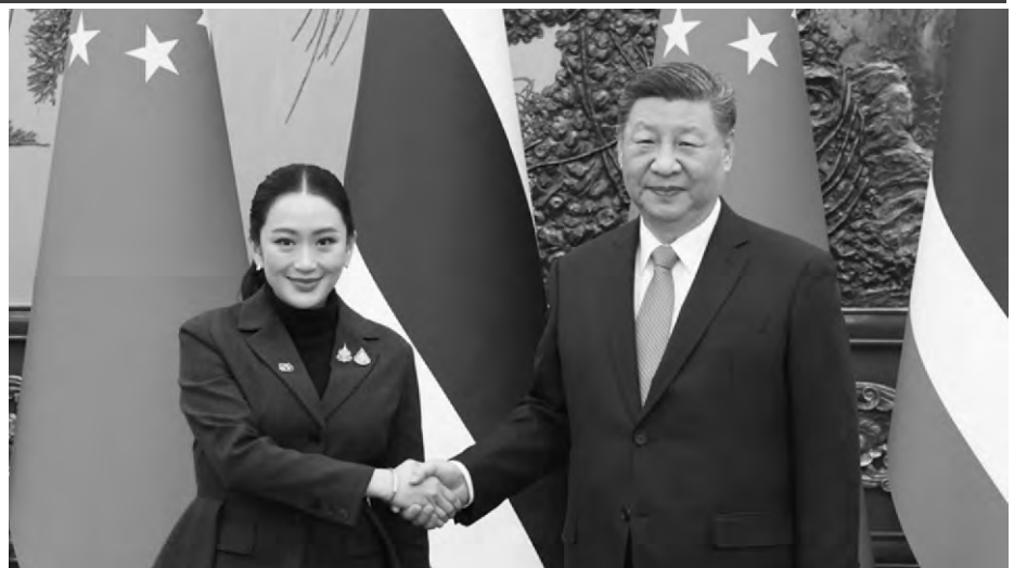
2月6日上午，中國國家主席習近平在北京人民大會堂會見來華進行正式訪問的泰國總理佩通坦。

佩通坦表示，很高興在「泰中友誼金色50年」之際訪華。50年來，泰中關係經歷風雨，始終守望相助、