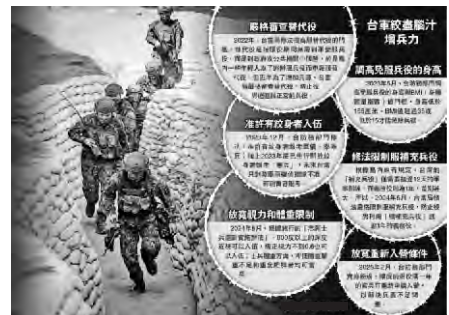
圖：台軍絞盡腦汁增兵力

我們發展兩岸關係的出發點和落腳點是增進同胞福祉，但民進黨當局卻說一套做一套，為了政治私利不惜損害台灣同胞利益福祉。搞“台獨”就沒有台海和平，謀分裂只會害台毀台。希望廣大台灣同胞從民族大義和自身福祉出發，與我們一道，堅決反對一切謀“獨”挑釁，共同維護台海和平穩定，共同推動兩岸交流合作，共同創造兩岸關係和民族覆興的美好未來。