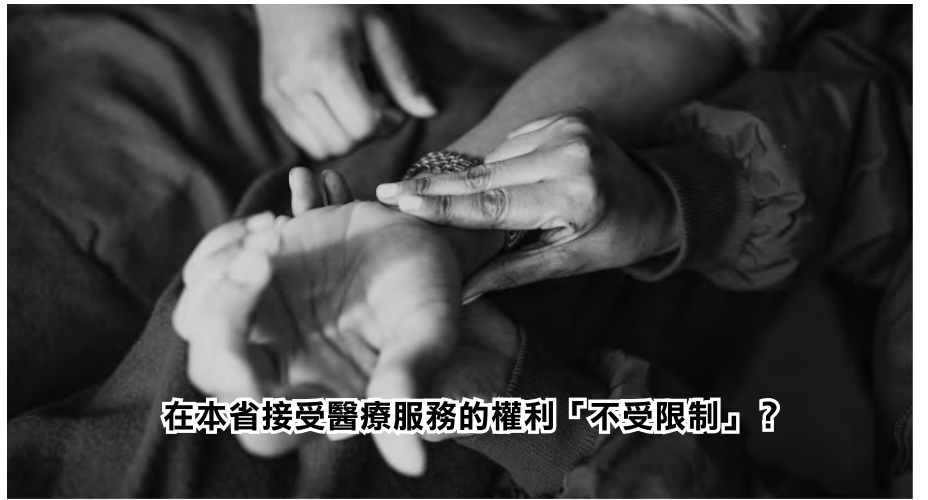
在本省接受醫療服務的權利「不受限制」？