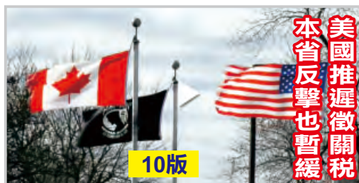
美國推遲徵關稅 本省反擊也暫緩