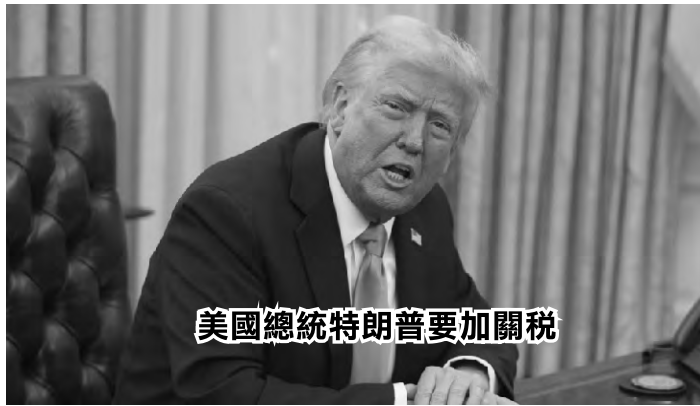
美國總統特朗普要加關稅

但South Shore Furniture家具公司在今天的新聞稿中指出，特朗普動機的不確定性嚴重影響了售，並補到說其百分之七十的產品銷往美國。