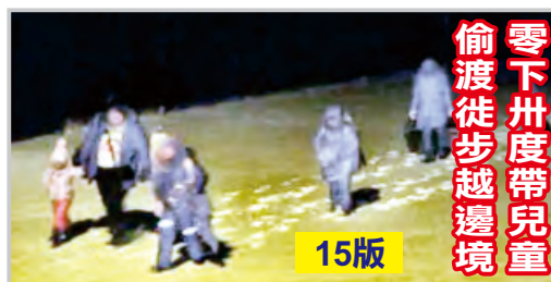
零下卅度帶兒童 偷渡徒步越邊境