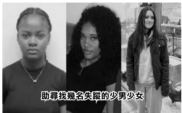
助尋找幾名失蹤的少男少女

褲子黑色耐吉鞋，背著帶有橙色線條的深色背包，現在可能穿著一件帶有灰色毛皮兜帽的黑色冬衣。根據描述他說法語，身高一點六八公尺（五英尺五英寸），體重五十九公斤（一百卅磅），長長的棕色捲髮和棕色的眼睛。