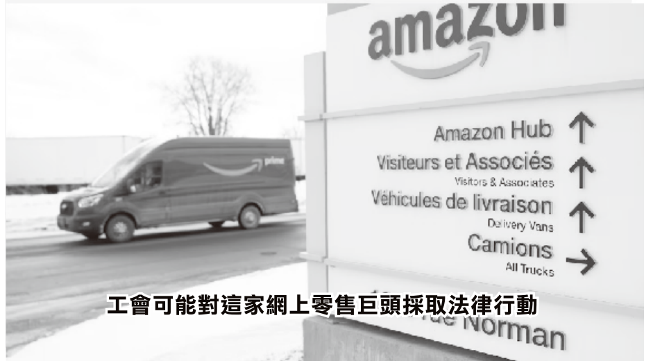
工會可能對這家網上零售巨頭採取法律行動

當上週五聯繫到亞馬遜尋求評論時，亞馬遜一發言人在一封電子郵件中解釋：「賈西的辦公室尚未回應這請求，但我們團隊再次向部長通報這決定仍然有效。」並補充