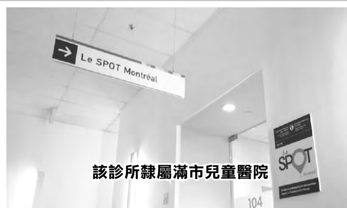
該診所隸屬滿市兒童醫院

「我想說的是，向支持你的人敞開心扉，他們會想聽你的，」她說。「他們永遠不會說你不够好，你不能這樣做，表達你的感受很重要。」