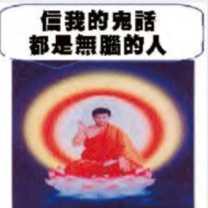
編造萬篇文章吹捧“神韻” 始作俑者正是李洪志