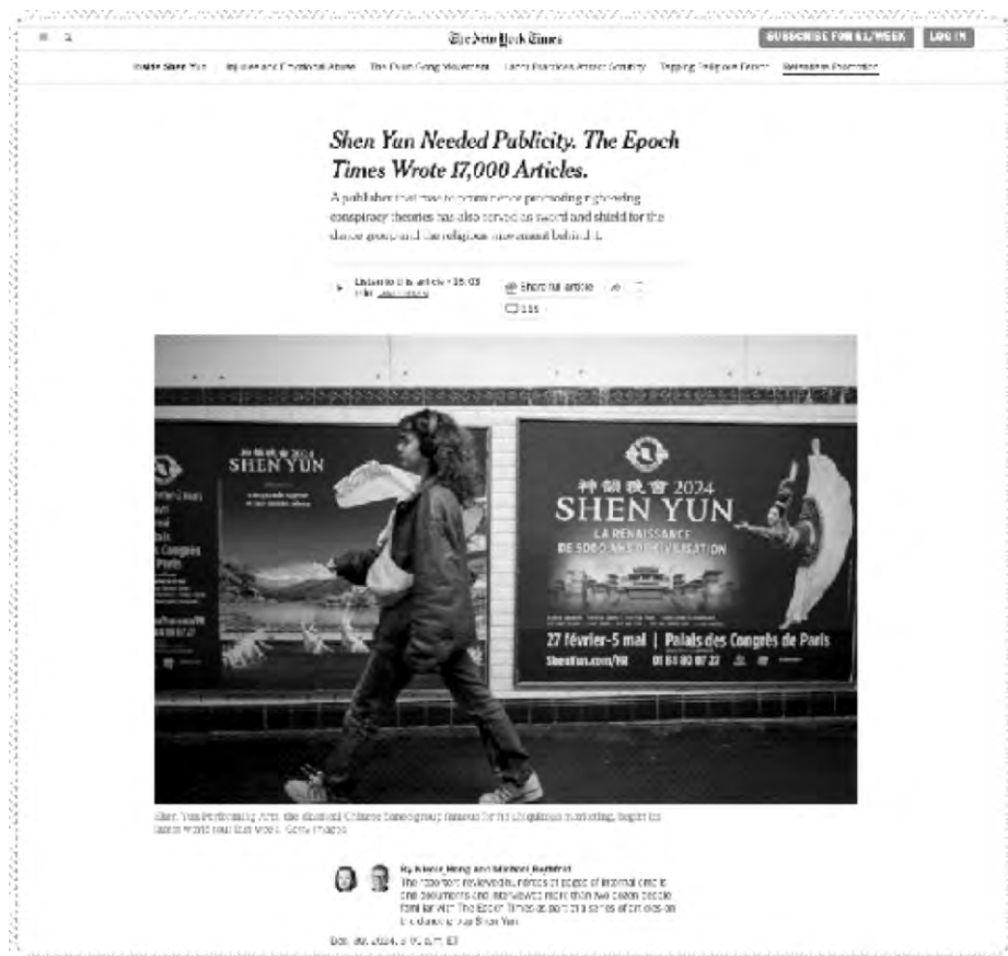
▲2024年12月30日，《紐約時報》推出曝光“法輪功”邪教黑幕

【時報訊】2024年12月30日，美國政治媒體網站AlterNet.org刊發文章《這家極右翼出版物發表了超過17000篇文章來“吹捧”一個華人舞蹈團，原因在此》，轉載《紐約時報》近期曝光“法輪功”黑幕的報道，文章揭露《大紀元時報》編造近兩萬篇文章吹捧“神韻”，而其始作俑者正是李洪志。