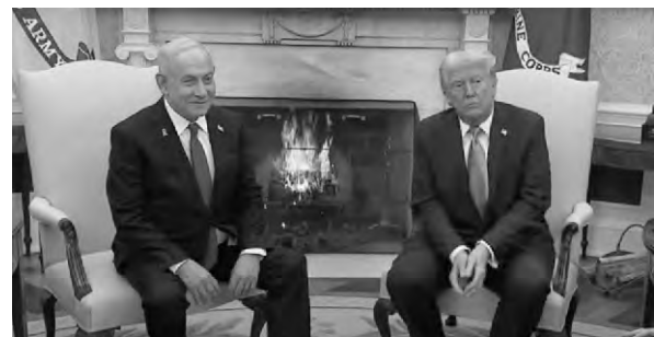
2月4日，特朗普與內塔尼亞胡會面 視頻截圖

中國外交部發言人林劍表示，中方反對針對加沙民眾的強制遷移，希望有關各方以加沙停火和戰後治理為契機，推動巴勒斯坦問題重回以“兩國方案”為基礎、政治解決的正確軌道，實現中東的持久和平。