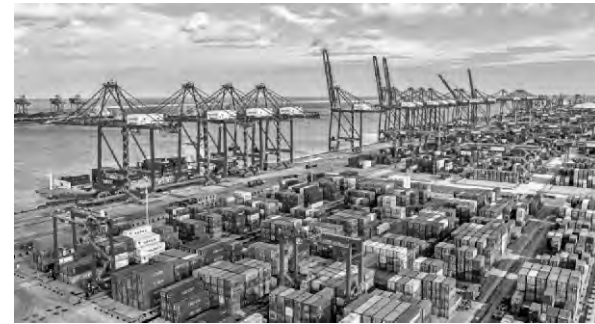
圖為山東港口日照港集裝箱碼頭。

商務部研究院學位委員會委員、研究員白明強調，貿戰無贏家，回擊美國無理挑釁，中方火力十