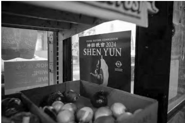
▲無處不在“神韻演出”廣告。原文配圖

【正義真相】據美國《紐約時報》2025年2月6日報道，美國國土安全部、美國國務院及曼哈頓聯邦檢察官辦公室對“法輪功”旗下“神韻藝術團”可能存在簽證欺詐行為開展調查。中國反邪教網摘譯如下：